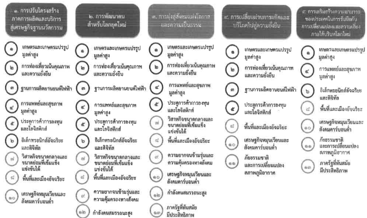
แผนภาพที่ ๓.๑ ความเชื่อมโยงระหว่างหมวดหมู่การพัฒนา กับเป้าหมายหลัก

ความเชื่อมโยงระหว่างหมวดหมู่การพัฒนา กับเป้าหมายหลักแสดงไว้ในแผนภาพที่ ๓.๑ โดยหมวดหมู่ การพัฒนาที่กำหนดขึ้นเป็นประเด็นที่มีลักษณะเชิงบูรณาการที่ครอบคลุมการพัฒนาตั้งแต่ในระดับต้นน้ำจนถึง ปลายน้ำ และสามารถนำไปสู่ผลพัฒนาทั้งในมิติเศรษฐกิจ สังคม ทรัพยากรธรรมชาติและสิ่งแวดล้อมไปพร้อมๆ กัน ทำให้หมวดหมู่แต่ละประการสามารถสนับสนุนเป้าหมายหลักได้มากกว่าหนึ่งข้อ นอกจากนี้การพัฒนากายใต้ แต่ละหมวดหมู่ไม่ได้แยกขาดจากกัน แต่มีการสนับสนุนหรือเอื้อประโยชน์ซึ่งกันและกัน