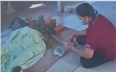
รูปภาพประกอบ